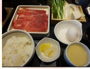
お肉は二段です お野菜も新鮮。