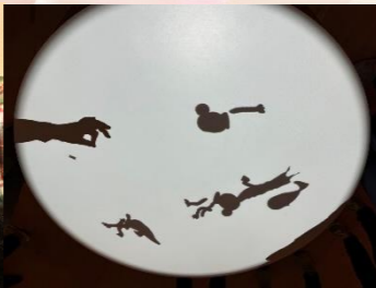
<toatope> テーブルにかざした手の影から生まれた「影」のイキモノがまるで命を吹き込まれたように動き回ります。