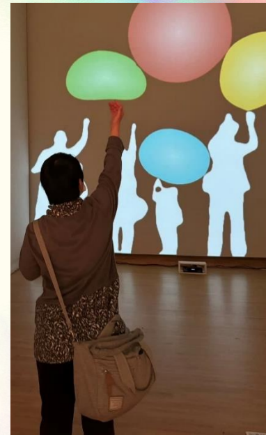
<Immersive Shadow:Bubbles> 影のボールに触れることができたような不思議な感覚です。