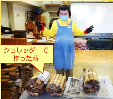
シュレッダーで作った薪