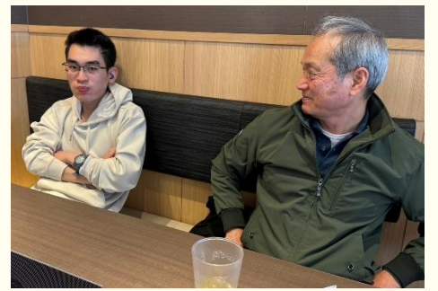
そして最後はおしゃべりタイム