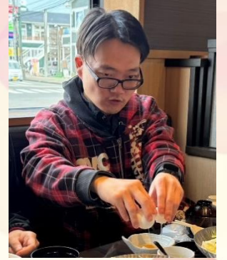
慎重に卵を割ります。ジョイッキングで 何度もしているので慣れたものです。