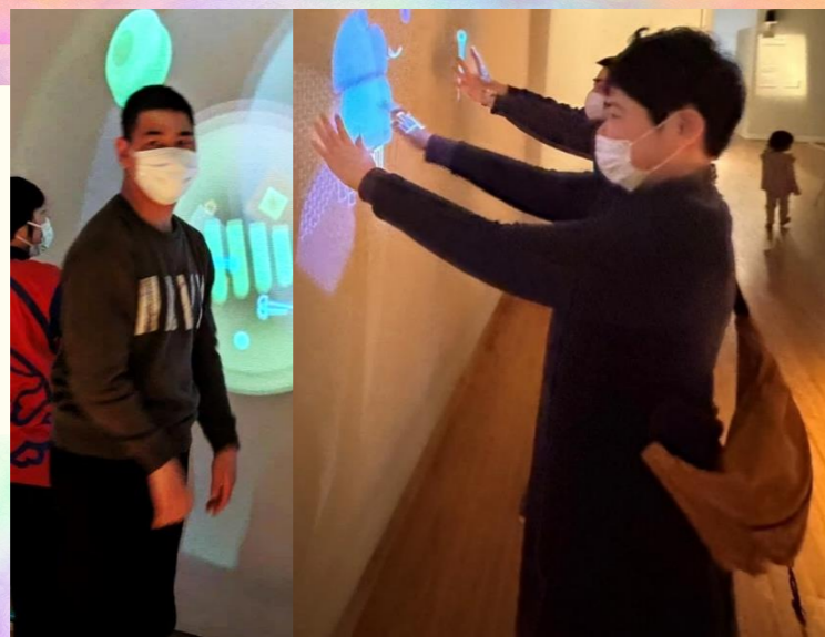
<ミルアンサンプル> 手をかざすと楽器が映し出され、音が鳴り始めます。