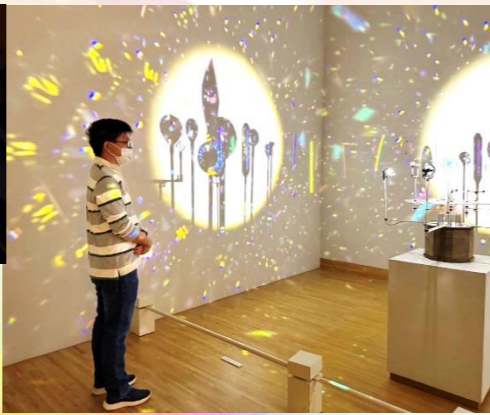
<アスタリス> 空間一面の虹色の星の光がきれいでした。