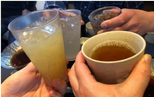
ご飯の後は ジュースでかんぱい!!