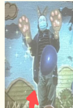
<幻想シアター> ステージに立つ役者になり、幻の生きものに変身して物語を演じることができます。