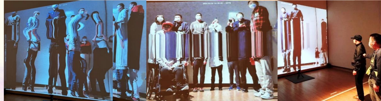
<SUPER SLIT-SCAN> 自分の姿が作品の中に入り込み、時空がゆがんだように不思議な世界が映し出されます。